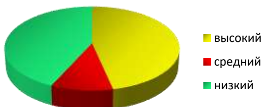
Результаты на конец года